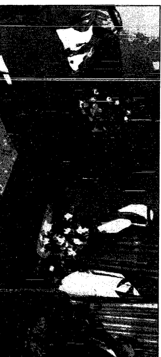
سور و المهد يجلس الرئيس الجزائري

[ صور يتطابق لـ حكايات ] واس - 1 ب - ق ن ا