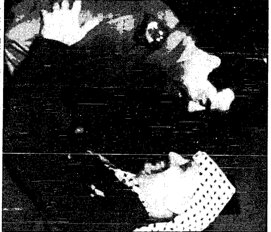
صدام حسين ورفقات يجتمعون قبل الجلسات الختمة في الساعة

[ صور يتطابق لـ حكايات ] واس - 1 ب - ق ن ا