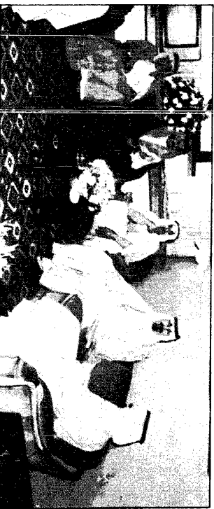
سور و المهد يجلس رؤساء الوفود السورية والسوري بالعراق

المصري : مرحلة جديدة من العلاقات الاخوية بين سوريا والمراوق واخبار سارة للمصالحة مروقات تورات تركز على العرب وقرعاتها والنزاع العربي الاسرائيلي عروفات : مباحثاتي مع الملك حسين « كانت اكثر من مصالحة » اتفقنا على التنسيق لهلحة شعبنا وقضيتنا المادلة