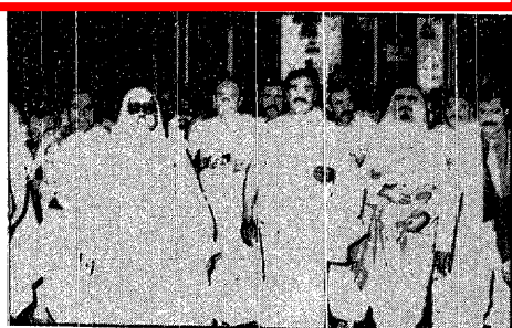
فخامة الرئيس العراقي يؤدي مناسك العمرة برفاقه الامير ماجد بن عبدالعزيز