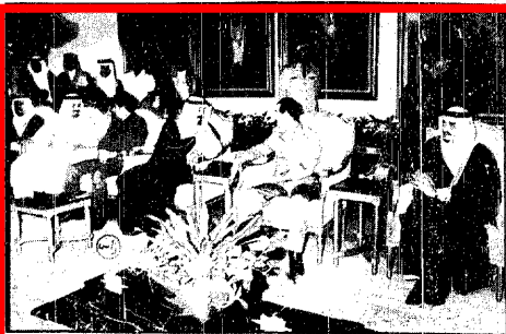
خادم الحرمين الشريفين وفخامة الرئيس العراقي أثناء الاجتماع الذي شارك فيه سمو ولي العهد وسمو الامير سلطان وسمو الامير عبدالرحمن وبنائب رئيس مجلس الوزراء العراقي