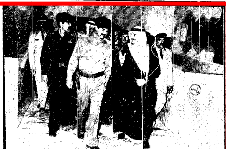
فخامة الرئيس العراقي يؤدي مناسك العمرة برفاقه الامير ماجد بن عبدالعزيز