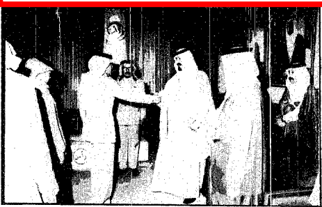
سمو الامير عبدالله يستقبل كبار ضباط الحرس الوطني