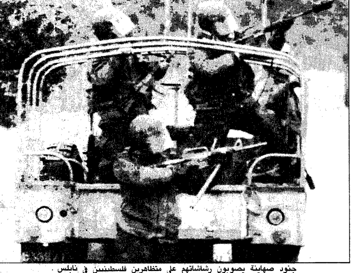
جنود صهيونية يصوبون رشاشاتهم على متظاهرين فلسطينيين في نابلس.

عبد اللطيف عبد الواحد - منصور عطية - عكاظ (استماع) - وكالات الأنباء (الأرض المحتلة) : انضمت هضبة الجولان السورية المحتلة اسم لانتفاضة الفلسطينية الشاملة ضد العدو الإسرائيلي واصيب ٣٠ شخصاً بجروح في بلدة مجدل شمس بعد ان اطلق جنود الإحتلال النار عليهم من مخيمهم المتخفيين. واصدرت منظمة التحرير الفلسطينية - القيادة الوطنية الموحدة للانتفاضة في المناطق المحتلة نداء حمل رقم - ٧ - تحت عنوان - لا صوت يعلو فوق صوت الانتفاضة - اكدت فيه اعتبار يوم غد الثلاثاء يوماً للأضراب الشامل وبمباراة للغضب الفلسطيني ضد الإحتلال. ودعا النداء الى الخروج في مظاهرات عارمة في الشوارع في كافة المخيمات والقرى والمدن في يوم القضاء على سكانها.