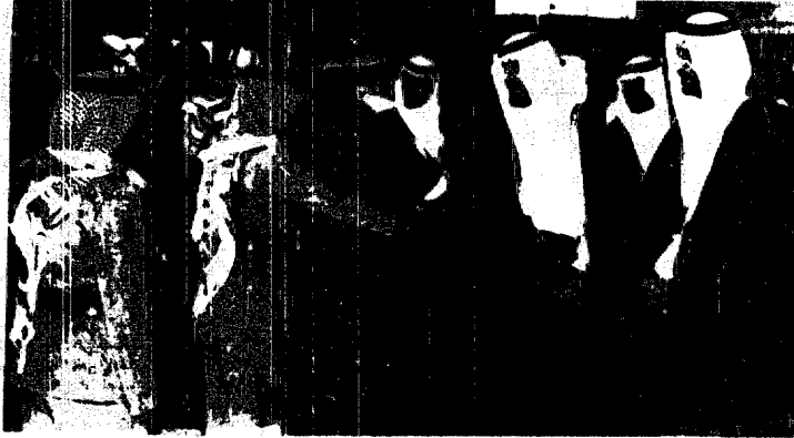
سمو ولي العهد يصافح كبار مودعيه أثناء مغادرته يحفظ الله مطار الملك خالد الدولي بالرياض متوجها إلى مسقط