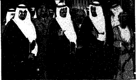
سمو ولي العهد أثناء مغادرته الرياض متوجها إلى مسقط أمس ويظهر في الصورة سمو الأمير سلطان وسمو الأمير سلمان.

الأمير عبدالله بن عبدالعزيز في مقر إقامة سموه مساء أمس سمو الشيخ سعد العبدالله السالم الصباح ولي العهد ورئيس مجلس الوزراء الكويتي وحضر المقابلة الوفد المرافق لسمو ولي العهد الكويتي والشيخ ناصر محمد الأحمد وزير الإعلام والشيخ راشد عبدالعزيز الرشيد وزير الدولة لشئون مجلس الوزراء والشيخ جابر مبارك الحمد محافظ مدينة الاحمدية كما حضر المقابلة الوفد المرافق لصاحب السمو الملكي الأمير عبدالله بن عبدالعزيز وسفير المملكة لدى عمان.