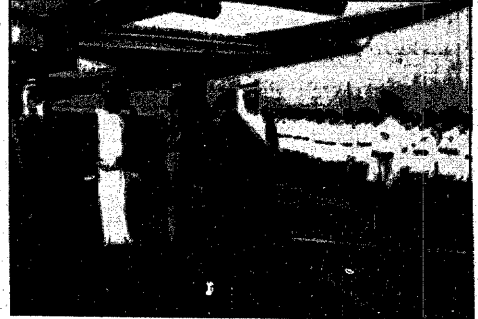
سمو ولي العهد يستعرض حرس الشرف بالمطار عقب وصوله إلى مسقط