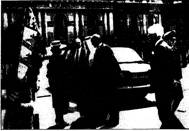
سمو الأمير عبدالله لدى وصوله الى مقر الحكومة البريطانية وانتشر ترحيب بسموه ..