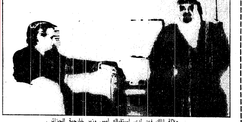
جلالة الملك فهد لدى استقباله أمس وزير خارجية الجزائر.

القدس المحتلة: بات من المؤكد ان تسقط حكومة شامير اليوم.. حيث سيقوم الكنيست بحل نفسه و إجراء انتخابات عامة مبكرة يعتقد المرابون انها ستشهد صراعات عنيفة على السلطة.