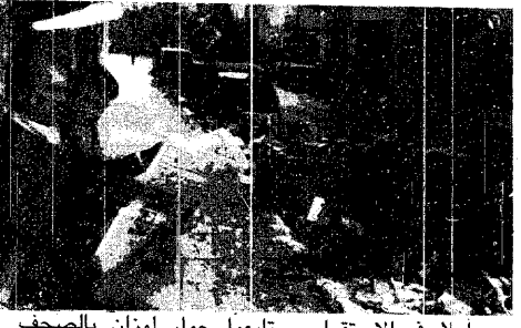
أملا في الاستقرار.. تابعوا حوار لوزان بالصحف