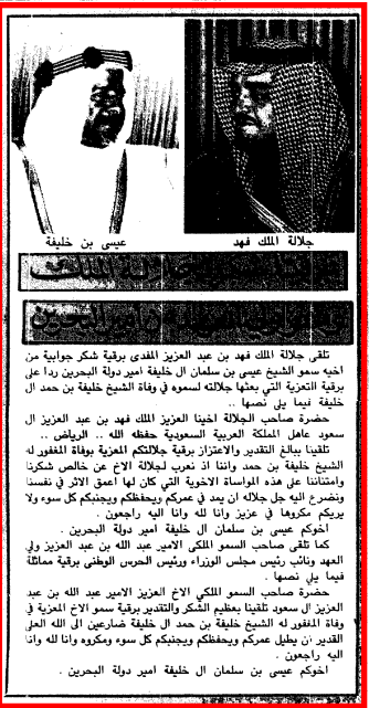
جلالة الملك فهد