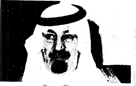
سمو الامير عبدالله بعد لقاء الوالد القائد