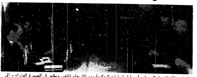
الرئيس اللبناني في الوسط يراس أول اجتماع للحكومة يوم الأربعاء الماضي ويظهر في الصورة الوزراء : اليمين : فيكتور قيسر ، سليم الحص ، كميل شمعون ، والى اليسار : جوزيف سكاف ، بيار الجميل ، عادل عسيران ، رشيد كرامي ، رئيس الوزراء

كرامى : مستعد لأب حل معقول إقتراحان للإنقاذ واتجاه لزيادة الوزراء عسيران : إرسال الجيش للجنوبية لتثبيته