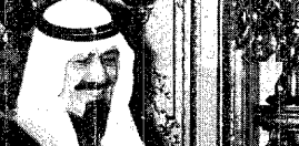
سمو الأمير عبدالله بن عبدالعزيز يصافح وزير العلاقات الخارجية الفرنسي لوران دوما قبيل بدء اجتماعهما أمس بفندق مارين في باريس .

وعند سؤال معاليه عن إمكانية تقديم فرنسا مساعدة حقيقية لأصدقائها في أفريقيا من شأنها أن تخفف من أعباء الماضي وأوضاع الحاضر المتخلفة عن الخلف والاستعمار . فأجاب معاليه في هذه النقطة وقال ان فرنسا تسعى بمسئوليتها تجاه الاستقرار والأمن في كل مكان ، وتولي اهتمامها في الدول النامية على وجه العموم ، وإن أفريقيا على وجه الخصوص أهمية خاصة وتتجاوز مع أي دعوة لها في المساهمة في حل قضايا هذه الدول السياسية والعسكرية والاقتصادية .