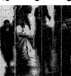
سمو الأمير عبدالله بن عبدالعزيز ورئيس وزراء فرنسا لوران فايوس يستعرضان حرس الشرف بالمطار لدى وصول سمو ولي العهد إلى باريس أمس الأول .

وقال في تصريح للصحافة السعودية في باريس : اني كنت سعيداً جداً بزيارة سمو ولي العهد لفرنسا وتكرمه بفيلو دعوتي لسموه لزيارة قصر البلدية حيث كان لنا شرف استقباله كما أجبني الوفد الرسمي المرافق لسموه عن زيارتهم لولاية باريس . وأعرب عن شكري الخاص للضيف معالي الشيخ جميل الجبران سفير المملكة في باريس حيث كان كادماً وراء كل الجهود البناءة والهادفة إلى تنمية وتطوير كافة أوجه العلاقات بين بلدنا . وما أجابت عن سؤال يتعلق بما دار في مباحثاتنا الخاصة مع سمو ولي العهد قال شيراك :