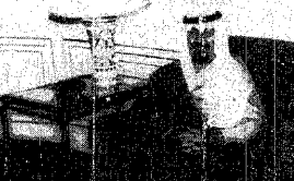
سمو ولي العهد خلال اجتماعه مع رئيس الوزراء الفرنسي لوران فايوس في باريس أمس الأول .

إثناء مباحثاتنا مع صاحب السمو الملكي الامير عبدالله بن عبدالعزيز ان نتعرف على وجهات نظر المملكة تجاه هذه القضية بصورة عامة ، وتجاه حالة الجمود الراهنة على ساحة الجهود المبذولة من أجل إنهاء هذه القضية . وطرحنا بعض التصورات التي قد تكون نواة عملية ، إما لشروع سلام فرنسي مستقل ، أو مجموعة أفكار لجهود فرنسية أوروبية مشتركة يمكن أن توفر ظروف تعاون أفضل في المستقبل القريب لتتقدم خطوة بخطوة نحو السلام والأمن لا بالنسبة للقضية الفلسطينية فحسب وإنما لسائر القضايا والمشاكل التي تشهدها المنطقة في أكثر من جبهه منها . وقد تكون هذه الأفكار نواة لحل أشمل يتصدر عن الأمم المتحدة ويحرك الوضع