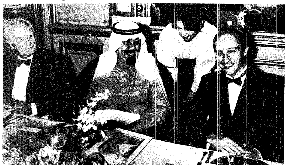
سمو الأمير عبدالله بن عبدالعزيز، ورئيس الوزراء الفرنسي لوران فايوس، في حديث باسم حفل العشاء الذي اقامه رئيس الوزراء الفرنسي تكريماً لسموه أمس الأول.