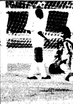
فرحة اتحادية بهدف التعادل

وعاد الاستاذ محمد حسن فقي الأديب والشاعر المعروف يعزتر عن المشاركة في حفل تكريمه [ ثقافة وفن ] رجال الملء - عكاظ السوق الخليلجية الحرة خطوة راشدة [ المال والاقتصاد ] كلمة طب القلبيوم توجه نداء عاجلا مساعدتها [ الوطن العربي ] هل هذا معقول؟ يجمعون البضائع التالفة من النفايات ويبيعونها في صناديق أنيقة [ سوق عكاظ ] حكاية كل بيت... أمواج المشاكل تصصف سفينة الزوار [ حياة الناس ] صورة مناصب الطلاب تمهين من مصيدة القتل [ الشريعة ] اليوم