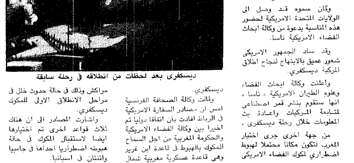
ديسكفري بعد لحظات من انطلاقه في رحلة سابعه

واس - كاب كاتيفيرال - الرباط - وكالات الأنباء: بعد تأخير لمدة ساعة ونصف الساعة بسبب الرياح الشديدة انطلق أمس عند الساعة السادسة و ٣٧ دقيقة مساء بتوقيت المملكة موكب الفضاء الأمريكي ديسكفري وعلى متنه خمسة رواد. وقد تابع ملايين الأمريكيين عبر شاشات التلفاز الدقائق الأخيرة للعد التنازل قبل إطلاق المركبة الفضائية كما تابع صاحب السمو الملكي الأمير سلطان بن سلمان بن عبدالعزيز من مركز كندي للإبحات الفضائية في كيب كاتيفيرال عملية الإطلاق. وكان سموه قد وصل إلى الولايات المتحدة الأمريكية لحضور هذه المناسبة بدعوة من وكالة أبحاث الفضاء الأمريكية ناسا. وقد ساء الجمهور الأمريكي شعور عميق بالإحباط لنجاح إطلاق المركبة ديسكفري. وأعلنت وكالة أبحاث الفضاء وعلوم الطيران الأمريكية « ناسا » أنها ستقوم بنشر تقرير استراتيجي لتدابير التبركات وإعادة بناء المعلومات خلال رحلة ديسكفري. من جهة أخرى جرى اختيار المغرب لتكون مكاناً مستقلاً لهبوط اضطراري لموكب الفضاء الأمريكي