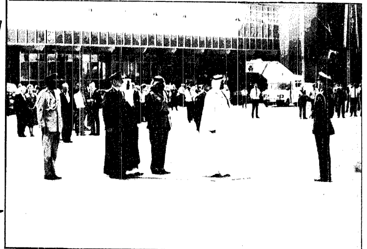
سمو ولي العهد يستعرض حرس الشرف ادى وصوله الى مطار دبلن امس الاول