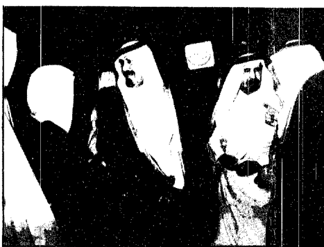
سمو ولي العهد لدى وصوله الى جدة

وبعث الامير حسن نائب الملك الحسين وولي عهد الاردن ببرقية إلى اوزال استنكر فيها محاولة الاعتداء على حياته ..