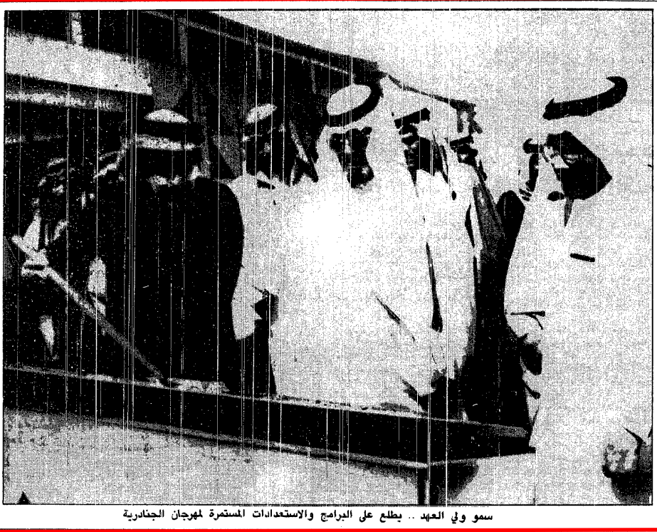
سمو ولي العهد .. يطلع على البرامج والاستعدادات المستمرة لمهرجان الجنادرية