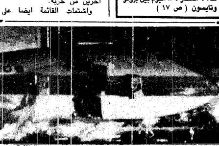
انار الانفجار الذي أحدث فجوة بيبدو واضحا على جسم الطائرة وهي رابضة في مطار هونولولو .

● لقاء العصر .. اليوم بين برونو وتابسون ( من 17 )