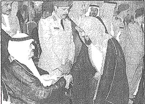
خادم الحرمين الشريفين يستقبل العلماء والمشايخ وجموعا من المواطنين