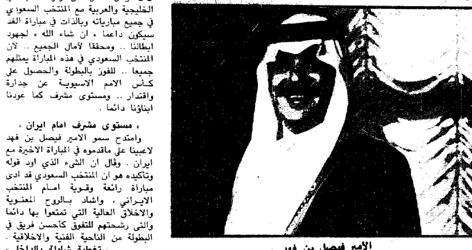
الامير فيصل بن فهد

سامي المهنا «خاص» الرياض: حث صاحب السمو الملكي الامير فيصل بن فهد بن عبدالعزيز الرئيس العام لرعاية الشباب ابطال المنتخب السعودي على مواصلة الجهد والعطاء لرفع راس العرب عالياً والفوز ببطولة اسيا يوم غد امام المنتخب الكوري وقال سموه في حديث خاص لعكاظ ان ما توهمه من ابطالنا ليس غريباً في ظل التشجيع الدائم والمسنن الذي تلقاه الرياضة عموماً ويحظى به ابطالنا لا يعب المنتخب من قبل خادم الحرمين الشريفين حفظة الله