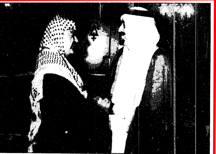
خادم الحرمين يستقبل ياسر عرفات

ومن المتوقع أيضا ان تبحث اللجنة الاعداد للمؤتمر العام لأوبك في ٢٦ نوفمبر القادم بينما من الجية ثالثة تشهد دولة الامارات العربية المتحدة خلال يومين القادمين مباحثات نفطية عامة حيث يصل