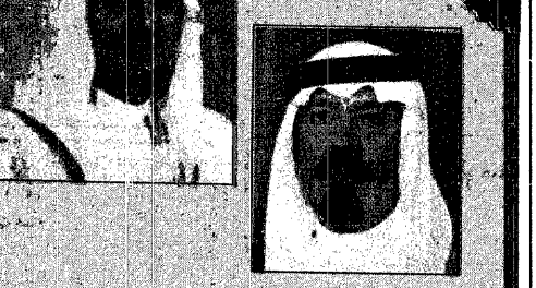
فضيلة الشيخ عبدالعزيز آل الشيخ

به المملكه من أمن ورضاه القاهما امس مسجد نمره - بجهد حكومة خادم الحرمين الشريفين في خدمة وعبادة الحجاج مشيراً الى ان هذه الجهود لا يتكرها الا حادق مريض .. ووصف حكومة المملكة بانها قيادة حكيمه نذرت نفسها لله ثم لخدمة الاسلام والمسلمين .