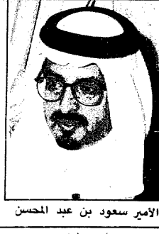
الأمير سعود بن عبد المحسن

محمد محبوب «بعثة عكاظ» - منى : أكد صاحب السمو الملكي الأمير سعود بن عبدالمحسن نائب أمير منطقة مكة المكرمة ونائب رئيس لجنة الحج المركزية ان الوضع الامني في المملكة عظيم وانه يكتفي بالسلامة الخاصة ممتاز وصلب . وقال في تصريح خاص لـ «عكاظ» ان الجريمة الكراه التي حدثت في مكة المكرمة ان تؤثر في الوضع الامني وصلابته . واضاف ان القاطنين الجبناء لا يستطيعون مواجهة صلاية الامن السعودي وقوته ولذلك يعتمدون مثل هذه الوسائل الدنيئة . واكد سموه ان التحقيقات جارية على قدم وساق وتدعو الله ان يوفقنا للكشف عن ملابسات الجريمة . وتسأل سموه قائلاً : لصالح من يقتل ويصاب الاثام من حجاج بيت الله الحرام . تفاصيل ص ٥