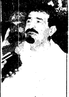
الأمير ماجد بن عبد العزيز

توجه حجاج بيت الله الحرام الى منى بعد فجر اليوم مواصلة أداء مناسك الحج بعد ان التقوا على صعيد عرفات امس في اعظم تجمع اسلامي خالد يجسد كل معاني الوحدة لله سبحانه وتعالى ثم فوضوا الليلة الماضية المباركة على صعيد مزدلفة في أمن وامان ويسر وسهولة.