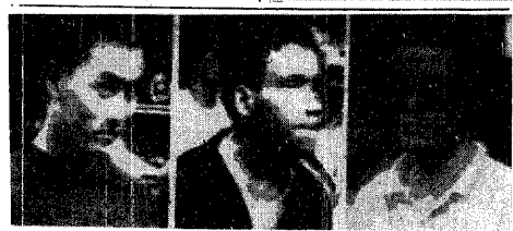
الثلاثة الذين تم تنفيذ احكام الاعدام بحقهم في الصين الشعبية امس في صورة ارضيقية سجلت من التلفزيون الصيني اثناء محاكمتهم. طالع ص ٦٠٥.