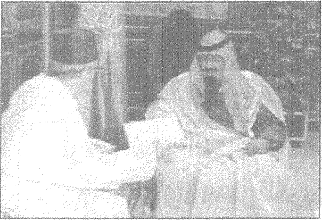
سمو ولي العهد خلال استقباله سفير المغرب لدى المملكة

واس - الرياض: تسلم صاحب السمو الملكي الأمير عبدالله بن عبدالعزيز ولي العهد ونائب رئيس مجلس الوزراء ورئيس الحرس الوطني من جلالة الملك الحسن الثاني ملك المملكة المغربية الشقيقة وصاحب السمو الملكي الأمير محمد بن الحسن ولي عهد المملكة المغربية. وقام بتسليم الرسائل لسمو ولي العهد سفير المملكة المغربية لدى المملكة عبدالرحمن السماري خلال استقبال سموه له بمكتبه بالديوان الملكي وحضر المقابلة معالي المستشار في ديوان سمو ولي العهد عبدالرحمن بن عبدالعزيز التوجيهي.