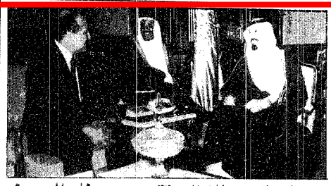
بريطانيا تهنيء بالنجاح وتقدر جهود خادم الحرمين

واس - جدة - عكاظ - الجزائر - وكالات الأنباء : أعرب خادم الحرمين الشريفين الملك فهد بن عبدالعزيز آل سعود عن استعداد المملكة العربية السعودية للاسهام في تخفيف آثار الزلزال الذي ضرب الجزائر. كما نقلت وكالة الأنباء السعودية عن اتصال الأمير سلطان بن عبدالعزيز آل سعود مع الرئيس الجزائري ليحيى خيرو، وذلك في إطار مساعي المملكة العربية السعودية للتوسط بين الجانبين الجزائريين المتنازعين، وذلك بهدف تحقيق السلام والاستقرار في الجزائر، وذلك من خلال الحوار والتفاوض.