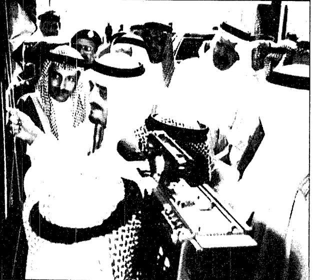
خادم الحرمين الشريفين يفتتح مسجد ميقات ذي الحليفة

الملك فهد يستقبل سمو ولي العهد والعلماء وكبار المسؤولين احمد الدوس ( المدينة المنورة ) - واس : اكاد خادم الحرمين الشريفين الملك فهد بن عبدالعزيز ان عملية التطوير نتجة في القريب العاجل نحو جميع المنشآت التي تقرر انشائها في المدينة المنورة وول مقدمتها مسجد رسول الله صلى الله عليه وسلم . وقال حفظه الله في كلمة ارتجلها عقب ازاحة الستار عن اللوحة التذكارية لمشروع اعادة عمارة مسجد الميقات ذي الحليفة ان جميع المشروعات التي يبرادها ان تؤسس في طيبة الطيبة وبخاصة ما يجب ان ينفذ في مسجد رسول الله لم نواجهنا فيها أية عوائق سواء كانت مادية أو خلافا . وكان خادم الحرمين الشريفين قد قام بزيارة تفقدية لمسجد الميقات ذي الحليفة بعد ان تم الانتهاء من اعادة عمارته وتوسيعه . وبعد ان انتهى من ارتجال كلمته توجه الى داخل المسجد حيث اطلع على المساحة الاجمالية التي يقع عليها المسجد وهي ثمانية وثمانين الف متر مربع . وتقدر الطاقة الاستيعابية للمسجد بخمسة عشر الف مصلى بعد ان كانت ستمت ستون الف مصلى فقط . وكان خادم الحرمين الشريفين الملك فهد بن عبدالعزيز قد ادى في المسجد النبوي الشريف صلاة الجمعة مع جموع المصلين امس . ثم غادر خادم الحرمين الشريفين حفظه الله المسجد النبوي الشريف متوجها الى مسجد الميقات ذي الحليفة لتفقد المنشآت القائمة به . وقد اصطلقت جموع المواطنين على جانبي الطريق مزجحة بنادح الحرمين الشريفين وداعية له بالشمع والتوبيخ . كما استقبل خادم الحرمين الشريفين حفظه الله في الديوان الملكي بضمير طيبة بعد ظهر امس صاحب السمو الملكي الامير عبدالله بن عبدالعزيز ولي العهد ونائب رئيس مجلس الوزراء ورئيس الحرس الوطني واصحاب السمو الملكي الامراء واصحاب القضاة العلماء وكبار المسئولين .