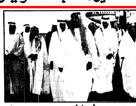
الملك فهد يتلقى برقية من صدام

واس ( المنامة ) - الدوحة - المدينة المنورة : بعث خادم الحرمين الشريفين الملك فهد بن عبدالعزيز الى سعود رسالتين الى كل من اخيه سمو الشيخ عيسى بن سلمان آل خليفة امير دولة البحرين واخيه سمو الشيخ خليفة بن حمد آل ثاني امير دولة قطر . وقام بتسليم الرسالة لسمو الشيخ عيسى بن سلمان آل خليفة معالي الدكتور محمد بن عبداللطيف المحم وزير الدولة وعضو مجلس الوزراء لدى استقبال سمو امير البحرين له بعد ظهر امس في قصر سموه بالمنامة . كما قام بتسليم الرسالة لسمو الشيخ خليفة بن حمد آل ثاني معالي الدكتور محمد بن عبداللطيف المحم لدى استقبال سمو امير قطر له في الديوان الاميرى بالدوحة صباح امس . ومن ناحية اخرى تلقى خادم الحرمين الشريفين الملك فهد بن عبدالعزيز برقية جوارية من فخامة الرئيس صدام حسين رئيس الجمهورية العراقية تفادصيل ( ص ٢ )