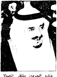
خادم الحرمين يتلقى اتصالا هاتفيا من مبارك

العدد 8289 - الأحد 24 ذي القعدة 1409 هـ - (11 السطران) 1217 هـ (الوافق 2 يوليو 1989 م) - السنة التاسعة والعشرون [ 66 ] - صفحة 2 - 8389 - 29 years - OKAZ Jeddah, Dhul Qidah 29, 1409 (Cancer 11, 1367) Sunday July 2, 1989