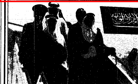
سمو الامير سلطان لحظة وصوله الى مطار اثينا

وقد اعرب نائب خادم الحرمين الشريفين في برقيته باسم شعب وحكومة المملكة وياسم خادم الحرمين الشريفين الملك فهد بن عبدالعزيز وياسمه شخصيا عن اجمل التهاني القلبية واصدق التمنيات الودية راجيا لجلالته دوام الصحة والهناء وللشعب الاردني الشقيق التقدم والازدهار في ظل قيادته الرشيدة. كما بعث نائب خادم الحرمين الشريفين صاحب السمو الملكي الامير عبدالله بن عبدالعزيز برقية تهنئة لفخامة الرئيس الدكتور راؤول الفونسين رئيس جمهورية الأرجنتين بمناسبة ذكرى استقلال بلايه. وقد اعرب صاحب السمو الملكي الامير عبدالله بن عبدالعزيز نيابة