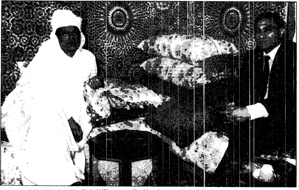
قمة - التصالح والوحدة - الرئيسان المصري حسني مبارك والليبي معمر القذافي في لقاء ثنائي على هامش القمة