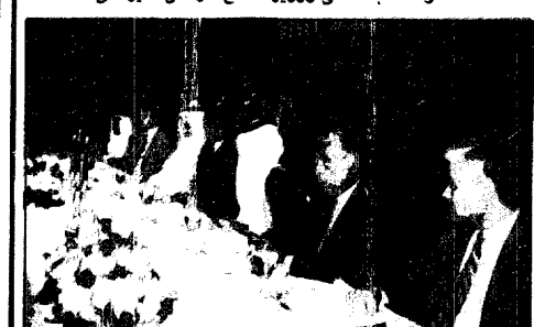
سموه في حفل العشاء الذي اقامه وحضره كبار المسؤولين اليونانيين والسفراء والدبلوماسيين العرب