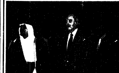
سمو النائب الثاني وزير الدفاع الوطني اليوناني