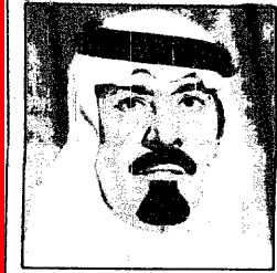
سمو الامير عبدالله

واس - الرياض: بعث نائب خادم الحرمين الشريفين صاحب السمو الملكي الامير عبدالله بن عبدالعزيز برقية تهنئة إلى اخيه جلاله الملك الحسين بن طلال ملك المملكة الأردنية الهاشمية بمناسبة الاحتفال بذكرى الاستقلال لبلايه.