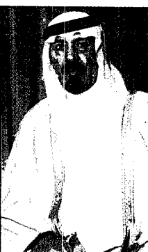
سمو ولي العهد

دعوة اسلامية للاعتراف بحكومة الجاهليين واس - القاهرة : ناشد المجلس الاسلامي العالي للدعوة والاعانة الدول الاسلامية بصفة خاصة والدول الاخرى بصفة عامة بشروط الاعتراف بحكومة الجاهليين في افغانستان . جاء ذلك في التوصيات التي اصدرها المجلس في ختام اعماله امس بالقاهرة واكد فيها تأييده لجهود اللجنة الثلاثية العربية لتحقيق السلام في لبنان . تفاصيل ص ٤