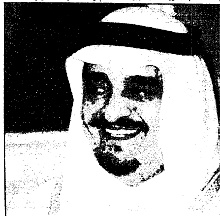
خادم الحرمين الشريفين

واضاف ان مرحلة تاسيس المملكة لم تكن سهلة بل اكتنفها الكثير من التحديات التي مكن الله الملك عبدالعزيز من مواجهتها بما حياه الله من ايمان وعزيمة كان نتاجها قيام المملكة دولة ينعم في ظلها المواطنين بأمن وارف واستقرار دائم ورفاه متصل وشهد - ايده الله - على ان المملكة لاتزال متمسكة بمنهج الملك عبدالعزيز في علاقاتها الخارجية وهو النهج القائم على الاحترام والتفاهل المتبادلين مع الاشقاء العرب والمسلمين ومع الاصداق وعدم التدخل في الشؤون الداخلية . واضاف خادم الحرمين الشريفين ان التعليمات الاساسية التي وضعها جلاله الملك عبدالعزيز اكدت على الوجه الشرعي للدولة والتزامها باحكام الشريعة الاسلامية . وتناول الملك الفدي واقم المملكة اليوم وخص بالحديث بتوسع دور التعليم والتدريب وابدى ارتيابه للنتائج التي وصل اليها مستوى التعليم والتدريب الذين وصفهما بانهما اعظم استثمار ومرمود للمملكة .