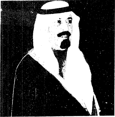
سمو ولي العهد

نتائج وقد فطن قادة المسلمين الى مخاطر وخطار الحرب الإيرانية العراقية على وحدة العالم الإسلامي، فانتقلوا يبدلون كل جهد لاخفاها وان املنا الشديد بان حصافة القيادتين العراقية الإيرانية تشكل جهود اورك القادة بالشجاعة والتوفيق. لها الاخوة المسلمون لا يسعني في هذه المناسبة مناسبة التخصيم والثناء الا ان اوجه التحية والتقدير لشعب افغانستان الصامد امام اند الاسلحة تكافؤا شديدا ولا عجب في ذلك فالؤمن يستشهد وكذا لا يهرم وهو وايهاه يترى مصير امته ويشق لتاريخ مجراه.