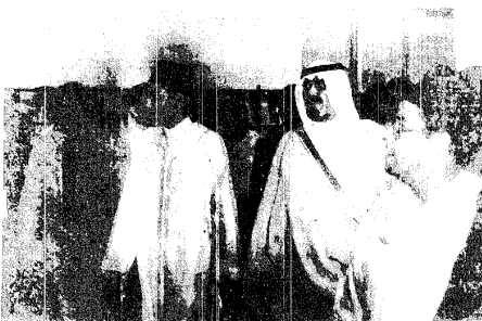
سمو ولي العهد يتفقد مكتبة المؤسسة