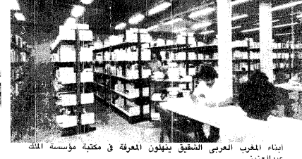
إبناء المغرب العربي يتناولون الصحف في مكتبة مؤسسة الملك عبدالعزيز