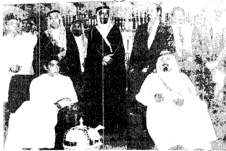
سمو الأمير عبدالله يتابع وولي عهد المغرب فقرات الاحتفال