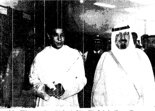
سمو الأمير عبدالله في طريقه لتفقد مكتبة مؤسسة الملك عبدالعزيز بعد افتتاحها

سفير المملكة لـ « عكاظ » الإنجاز مساهمة كبيرة لتعزيز التعاون المشرم بين المملكة والمغرب . التنازلي لـ « عكاظ » : إنجاز حضاري يؤكد مواصلة الإشعاع السعودي بقيادة جلالة الملك فهد