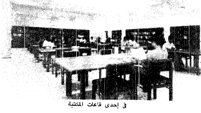
في إحدى قاعات المكتبة

وقال أن المؤسسة ستعمل على توفير مجموعة من الكتب والوثائق الإنسانية التي تساهم في إثراء البحث العلمي حول التراث الثقافي لمغربنا الإسلامية المختلفة.