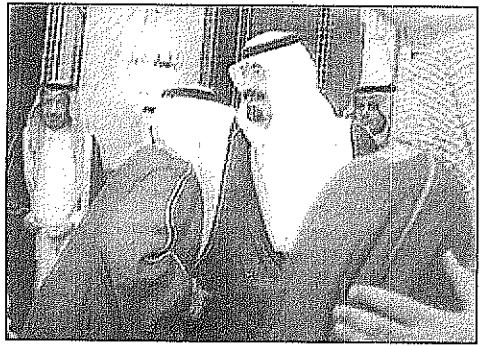
سمو ولي العهد يستقبل المهنيين بسلامة الوصول

[واس - الرياض] صاحب السمو الملكي الامير عبدالله بن عبدالعزيز ولي العهد ونائب رئيس مجلس الوزراء ورئيس الحرس الوطني استقبل امس في الديوان الملكي بقصر اليمامة بالرياض اصحاب السمو الملكي الامراء ومعالي رئيس مجلس الشورى واصحاب المعالي الوزراء وكبار قادة وضباط الحرس الملكي الذين قدموا للسلام على سمو ولي العهد وتهنئته بسلامة الوصول. وحضر الاستقبال صاحب السمو الامير عبدالرحمن بن عبدالله بن عبدالعزيز وصاحب السمو الملكي الامير عبدالعزيز بن عبدالله بن عبدالعزيز ومعالي عبدالمحسن بن عبدالعزيز التويجري المستشاران في ديوان سمو ولي العهد. كما استقبل صاحب السمو الملكي الامير عبدالله بن عبدالعزيز ولي العهد ونائب رئيس مجلس الوزراء ورئيس الحرس الوطني امس في الديوان الملكي بقصر اليمامة بالرياض اصحاب الفضيلة العلماء والمشايخ الذين قدموا للسلام على سمو ولي العهد وتهنئته بسلامة الوصول.