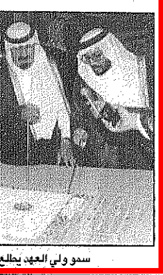
سمو ولي العهد يطالع على مجسم مركز الأورام

[محمد النوسائي - واس - جدة] صاحب السمو الملكي الأمير محمد بن عبدالعزيز آل سعود، ولي العهد نائب رئيس مجلس الوزراء وزير الدفاع، حضر يوم الأربعاء ٢٢ من ربيع الأول ١٤١٨ هـ الموافق ٢٠ يوليو ١٩٩٧ م، حفل وضع حجر الأساس لمركز الأورام في مدينة جدة، بحضور عدد من المسؤولين الحكوميين والعلماء والفرسان السعوديين، ووجوه من المجتمع المدني.