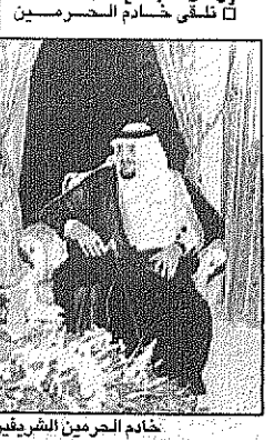
خادم الحرمين الشريفين يستقبل وزير الداخلية اليمني محمد الكعاب

[وايس - جدة] تلقى خادم الحرمين الشريفين الملك فهد بن عبدالعزيز آل سعود - حفظه الله - رسالة من الرئيس اليمني فخر بن عبدربه منصور هادي، أعرب فيها عن شكره على تلبية الدعوة لاستقباله في مدينة الرياض، وأكد على حرصه على تعزيز العلاقات الثنائية بين البلدين الشقيقين، والتعاون في مختلف المجالات الاقتصادية والتجارية.