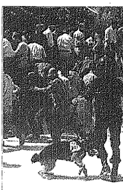
(تفاصيل ص ١٤)

[انقرة] الآلاف الطلاب احتجوا امس الثلاثاء ساحة كينايلا، وسط انقرة احتجاجاً على مشروع قانون مثيري - حسب معارضين - الى اغلاق المدارس الثانوية في مدارس الفقه الاسلامي في سبعة التي تخرج الائمة وكهنة المساجد. ورفع خمسة آلاف على الاقل من المتظاهرين الذين جاؤوا من مدن عديدة من بينها اسطنبول شعارات اسلامية واعلاماً خضراء وبنفسجياً، واصروا ايدي من يحاولون المساس بالقرآن. ويجعل قريبا مشروع قانون يمنح على زيادة مدة التعليم الازامي من خمس الى ثمان سنوات على البرنامج مما يترتب عليه تقييداً اخلاق الاقسام الثانوية في المدارس الاسلامية. واغلقت قوات الامن مبني البرلمان بينما كان المتظاهرون يقدمون الى وسط انقرة مردين حفلات مناضة لرئيس الوزراء مسعود يلماظ ونائبه بولنت اجاويد. ووافقت الشرطة ٥٠ شخصاً بين المتظاهرين قيد التحقيق.