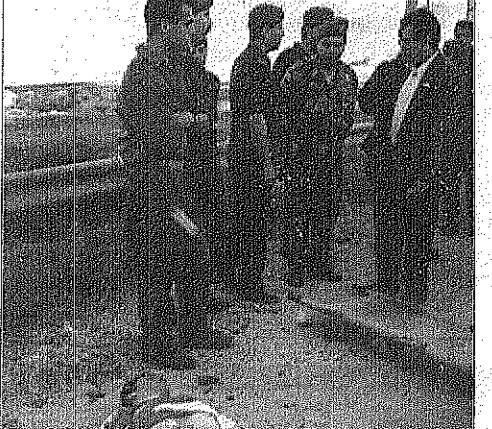
الشرطة الفلسطينية والجنود الاسرائيليون يقفون جوار جثة فلسطيني الذي قتلته جندي اسرائيلي بالقرب من مستوطنة ابون موريا، امس. (١٤)