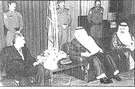
سمو الأمير نايف يستقبل الملك عبد الله الثاني