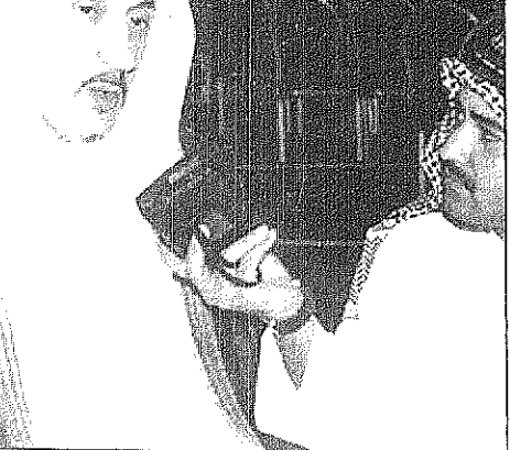
معايير وزير الصحة يتحدث لعماد

الخدمات الصحية الطبية بالمنطقة الغربية بمستشفى الملك خالد الحرس الوطني قال قائد ليس غريبا على قيادتنا الرشيدة ان تسعى لخدمة ابناءنا بتوفير افضل سبل الرعاية الصحية المتكاملة واحسن التقنيات الطبية الحديثة. واضاف ان مركز الاورام بمستشفى الملك خالد الحرس الوطني يأتي في اطار الاهتمام الكبير بصحة المواطنين ويحسد الجهود الكبيرة التي يبذلها القطاع الصحي في توفير كفاءة الخدمات الصحية المتخصصة في امراض السرطان والوقاية والعلاج والتأهيل لهذا المركز سموه بجمدة وقال ان هذا المركز سكنوا اضافة جديدة لتقديم افضل الخدمات الصحية للمواطنين.