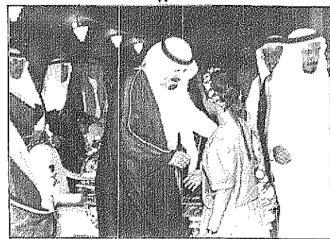
سمو ولي العهد يستقبل سفير سلطنة عمان