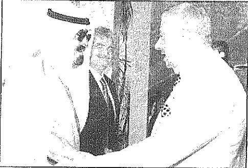
زيارة سمو ولي العهد للبنان حققت غاياتها المنشودة