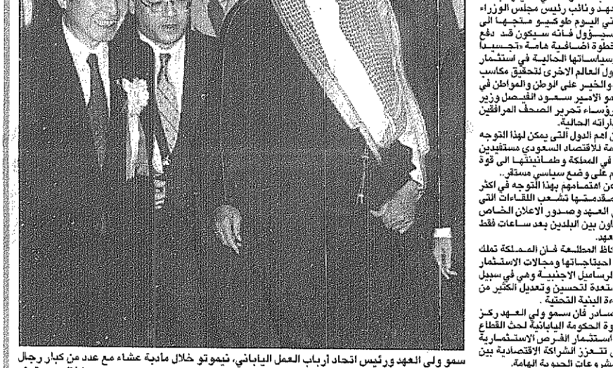
سمو ولي العهد ورئيس اتحاد ارباب العمل الياباني، تموتو خلال مائدة عشاء مع عدد من كبار رجال الاعمال اليابانيين في طوكيو، تكريماً لسموه.

اتخذت المملكة واليابان يوم امس خطوة عملية جادة في اطار العمل البناء لتفعيل الاستراتيجية التعاونية الموسعة بين البلدين في المجالات الاقتصادية والتجارية والصناعية والعلمية والتربوية والثقافية والشباب والرياضة.