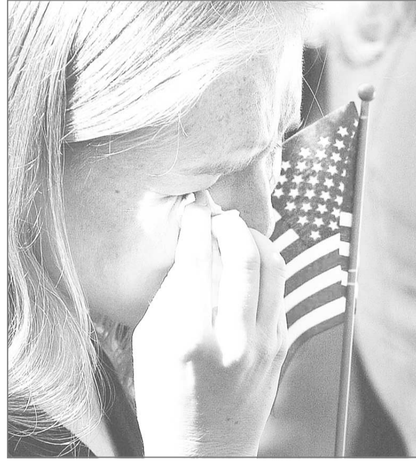
أمريكية تبكي خلال الاحتفال بالذكرى في لندن أمس.