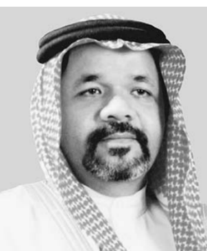
د. الفارسي (الرياض)

اجتمع وزير الاعلام الدكتور فؤاد بن عبدالسلام الفارسي في مكتبه امس مع عدد من المسؤولين في الوزارة، واطلع منهم على الاستعدادات البرامجية لشهر رمضان المبارك في جهاز الاداعة والتلفزيون بصيغها النهائية. وأوضح وزير الاعلام ان هذه البرامج التي تنوعت في مضامينها من دينية وثقافية واجتماعية وتاريخية ومسابقات ومسلسلات سمع الى ايجاد التوازن لتحقيق الرغبات المتباينة للمتلقين.