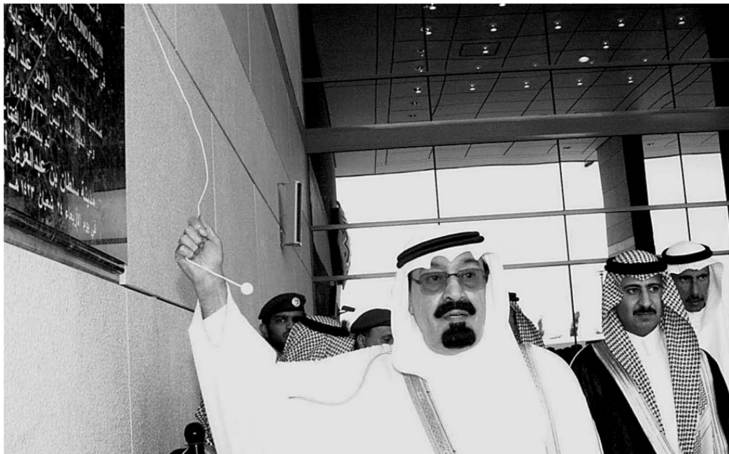
سمو ولي العهد يلاطف أحد اشبال الوطن خلال جولته في المدينة

وقال سموه انه ما علم عدد من محبي الخير عن مدينة سلطان بن عبدالعزيز للخدمات الانسانية وما تقدمه لذوي الاحتياجات الخاصة الا وهبوا للمشاركة في عمل الخير وذلك بمساعدة المرضى الذين لا يستطيعون تحمل تكاليف العلاج واستجابة لرغبتهم فقد وافق سمو الامير سلطان بن عبدالعزيز على انشاء صندوق خيري لمساعدة المرضى المحتاجين وسوف يتم تزويد كل مترقب للصندوق عن الكيفية التي صرف فيها تبرعه والاشخاص الذين استفادوا من ذلك التبرع.