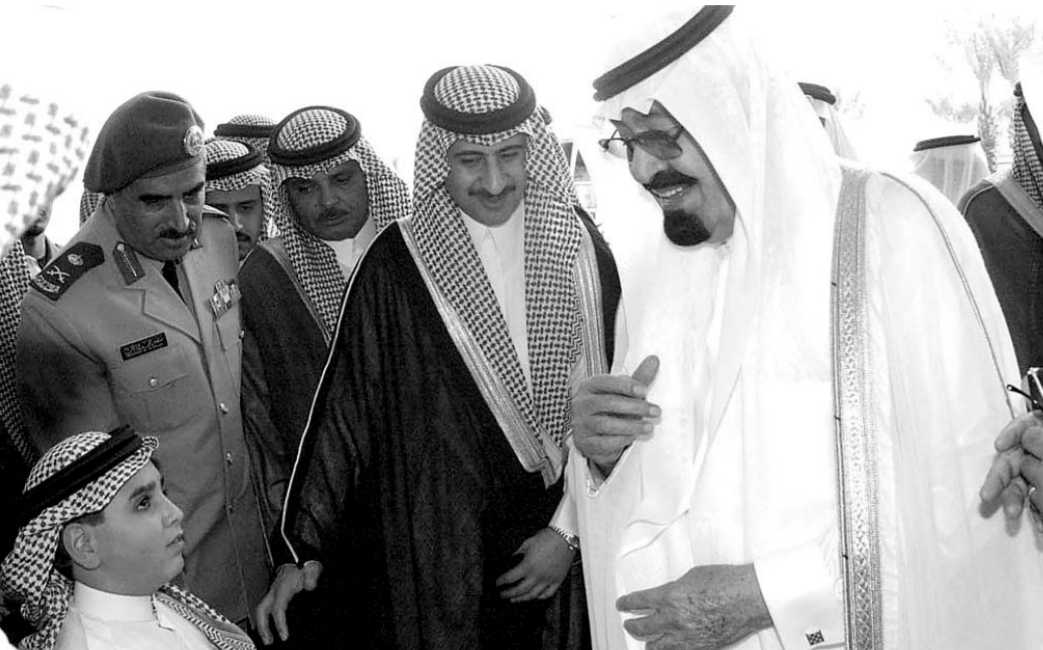
سمو ولي العهد يلاطف أحد اشبال الوطن خلال جولته في المدينة