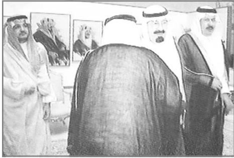
■ نائب الملك لدى وصوله جدة أمس

واس (أبها، جدة، الكويت ، ابوظبي، المنامة)