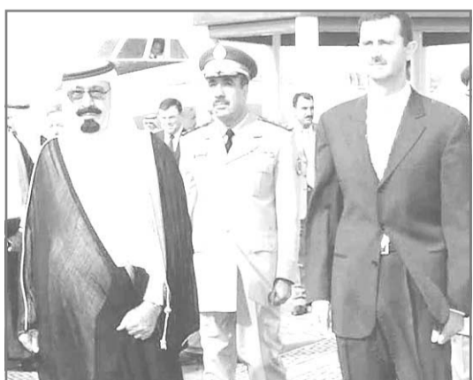
■ سمو ولي العهد يستقبل الرئيس بشار الاسد

القوة العربية صحب صاحب السمو الملكي الامير عبدالعزيز فخامة الرئيس الدكتور بشار حافظ الاسد في موكب رسمي الى المقر المعقد لاقامته .