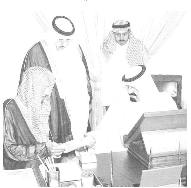
سموه يستقبل المواطنين