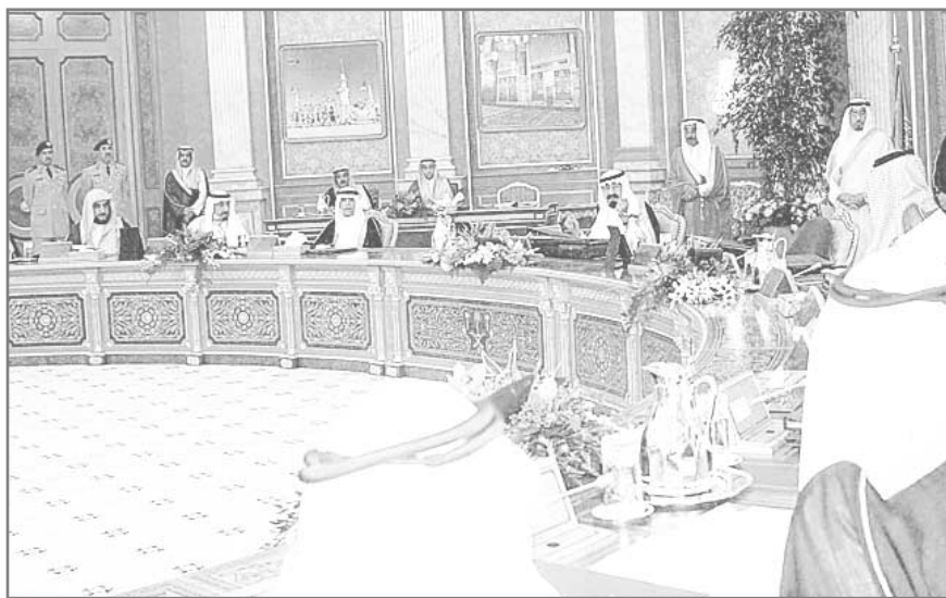
■ نائب الملك يرأس جلسة مجلس الوزراء