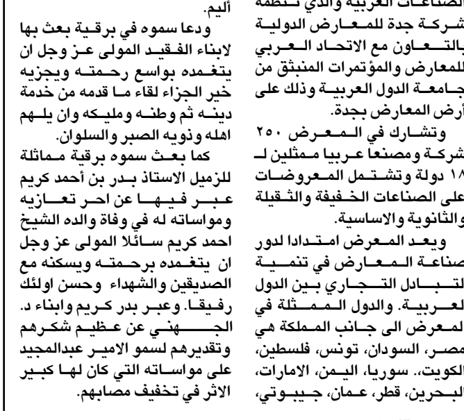
■ الامير عبدالمجيد

الصناعات العربية والذي تنظمه شركة جدة للمعارض الدولية بالتعاون مع الاتحاد العربي للمعارض والمؤتمرات المنتيق من جامعة الدول العربية وذلك على أرض المعارض بجدة. وتشترك في المعرض ٢٥٠ شركة ومصنعا عربيا معتلين لـ ١٨ دولة وتشتمل المعارضات على الصناعات الخفيفة والثقيلة والتأهوية والاساسية. ويعد المعرض امتدادا لدور صناعة المعارض في تنمية التبادل التجاري بين الدول العربية، والدول الممثلة في المعرض الى جانب المملكة هي مصر، السودان، تونس، فلسطين، الكويت، سوريا، اليمن، الإمارات، البحرين، قطر، عمان، جيبوتي، الاثر في تخفيف مصابهم.