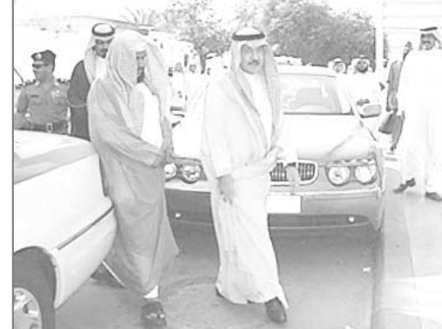
■ الامير سظام لدى وصوله للصلاة على الفقيد

الله أن يتغمده بواسع رحمته وان يلهم اهله ومحبيه الصبر والسلوان وان يوفى بول». وقد شملت المزايدة الاولى والثانية ٥٢ موقعا لتركيب لوحات اعلانية من نوع «موبي» وسككون يوم الثلاثاء الموافق ٢٤/١١/٢٠٢٢هـ آخر موعد لقبول عطاءات هذه المناقصتين. اما المزايدة الثالثة فقد شملت ١٠ مواقع لتركيب لوحات اعلانية من نوع «يوتي بول»، على أن يتم قبول عطاءات هذه المناقسة حتى يوم الاثنين الموافق ١/٨/٢٠٢٣هـ