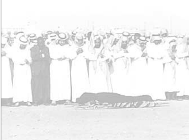
■ أداء الصلاة على الميت في المقبرة