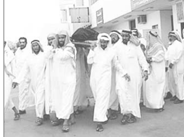
■ أثناء تشييع الجثمان