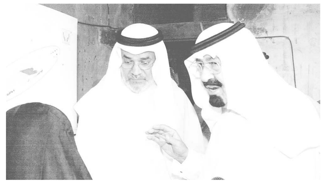
سموه يستمع الى امرأة تشكو ويوجه النملة بمتابعة حالتها

والدأب على تهيئة البيئة المناسبة لحياة كريمة لجميع فئات المواطنين وقد وعدهم رب العزة والجلال بالاجر العظيم «وأحسنوا ان الله يحب المحسنين» وقال تعالى: «انا لا نضيع اجر المصلحين» وقال جل وعلا «ان الله لا يضيع اجر المحسنين» وفقهم الله تعالى الى كل خير وأعانهم على الاستمرار في فعل الخير.