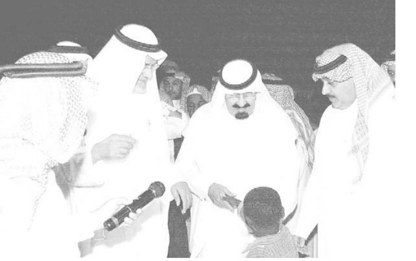
سموه يسأل طفلا عن حاله

بقدر عال من الواقعية والقابلية للتطبيق بحسب الامكانيات المادية المتاحة وقد أوعز التوجيه الكريم لوزير العمل والشؤون الاجتماعية بالاستعانة بالجامعات ومراكز البحوث وبيوت الخبرة كما ترك له المجال لاقتراح الآلية التي ستنفذ بها الاستراتيجية حال الموافقة عليها من خادم الحرمين الشريفين الملك فهد بن عبدالعزيز حفظه الله ورعاه وذلك من حيث تطوير الاجهزة الضامنة أو ايجاد جهاز تنسيقى للجهات الاجتماعية يشمل ما تنفقه الدولة وما ينفقه القطاعان الاهلي والخيري ويكون مسؤولا عن موضوع الفقر في المملكة من حيث اجراء المسوحات وحصر أعداد الفقراء وتوزيعهم وخصائصهم واجداد الحلول المناسبة لذلك كالتأكد من شمولية الضمان الاجتماعي والنظر في زيادة مخصصاته وزيادة دعم الجمعيات الخيرية والتوسع في الترخيص لها ضمن الضوابط التي تملئها لائحة الجمعيات الخيرية ونحو ذلك من الحلول التي يتوقع للاستراتيجية الوطنية أن تنهجه للحد من الفقر.