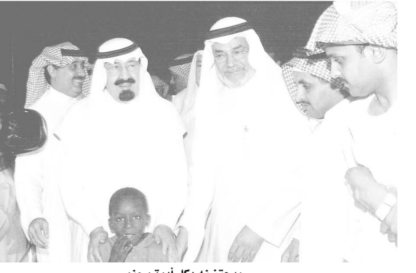
ويحضنه بكل ابوة وحنو