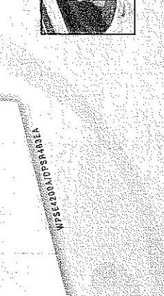
اسماء واختيار واحدة بك