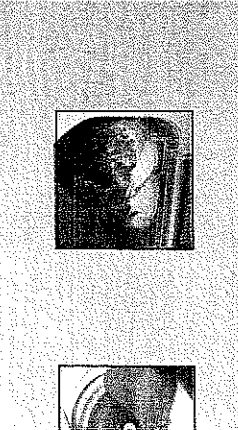
اسماء واختيار واحدة بك