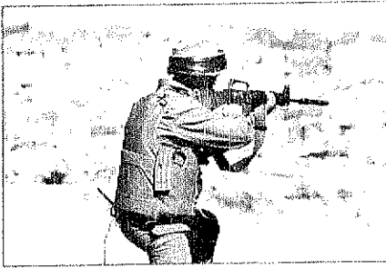
جندي اسرائيلي يطلق النار على فلسطينيين حاولوا الدخول الى رام الله امس

سلفا في قطاع غزة وقوات الاحتلال الذي فرض على قرية وادي السلفا وحى أبو الهول قرب دير البلح جنوب قطاع غزة رفع عند الساعة السادسة بالتوقيت المحلي لكثبان أسلاك إن جنودا اسرائيليين ادخلوا منزلا في وادي السلفا وتمركزوا على سطحه لتفتيش من دراية منطقتي أبو الهول والبلدة بالإضافة إلى حي أبو الهول وقسم من دير البلح وقسم من بلدة وادي السلفا. ذلك يعني انهم يصلون احتلال هذه المنطقة. وفي خان يونس أعلنت مصادر فلسطينية ان القوات الاسرائيلية قصفت شريان السلفا بالرشاشات بالجنود منازل المواطنين الفلسطينيين في الحي المتحصن الى الغرب من محافظة خان يونس والشارب المتحصن الى ان قوات الاحتلال قصفت نيران رشاشاتها الثقيلة وبشكل مستمر باتجاه عدد من سيارات المواطنين الفلسطينيين التي المنطقتين بما أدى الى اشتعال نيران في سيارات عدد من المواطنين الفلسطينيين. من جانبها نفت الجرائد جيسال الامن الدولي ان التدخل العسكري الاسرائيلي في قطاع غزة قد استمر.