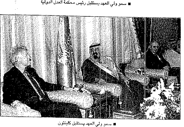
سمو ولي العهد يستقبل كابيتون

واس (الرياض) □ استقبل صاحب السمو الملكي الأمير عبدالله بن عبدالعزيز ولي العهد نائب رئيس مجلس الوزراء ورئيس الحرس الوطني في قصر سموه بالرياض أمس دولة الرئيس الأفغاني الموقت حامد قرضاي والوفد المرافق له الذي يزور المملكة العربية السعودية حالياً. وقد عقد صاحب السمو الملكي الأمير عبدالله بن عبدالعزيز ودولة الرئيس صامع قرضاي اجتماعاً ربح سموه ولي العهد في بدايته باسم خادم الحرمين الشريفين الملك فهد بن عبدالعزيز آل سعود وباسمه وباسم حكومة وشعب المملكة العربية السعودية ببلولة الرئيس الأفغاني الموقت وتمنى له التوفيق والنجاح لخدمة دينه وأمتة الإسلامية وبلده أفغانستان الشقيقة وشعبها. وأطلع دولة الرئيس صامع قرضاي على الأوضاع في أفغانستان، وتم خلال جلسة المباحثات استعراض أفاق التعاون بين البلدين ومجمل الأوضاع على الساحتين الإسلامية والدولية. وحضر الاجتماع صاحب السمو الملكي الأمير نايف بن عبدالعزيز وزير الداخلية وصاحب السمو الملكي الأمير أحمد بن عبدالعزيز نائب وزير الداخلية وصاحب السمو الملكي الأمير عبدالعزیز بن فهد بن عبدالعزيز وزير الدولة عضو مجلس الوزراء ومعالى وزير الديوان الملكي الأستاذ محمد التويصر رئيس ديوان رئاسة مجلس الوزراء ومعالى وزير الديوان الملكي الأستاذ صالح البراهيم وسفير دولة فلسطين لدى المملكة مصطفى الشخيتي.