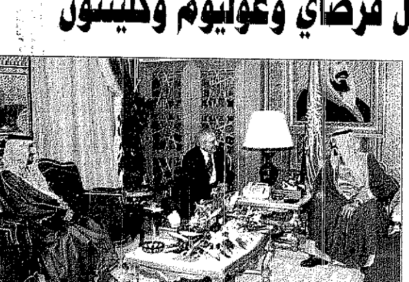
سمو ولي العهد يستقبل رئيس محكمة العدل الدولية

واس (الرياض) □ استقبل صاحب السمو الملكي الأمير عبدالله بن عبدالعزيز ولي العهد نائب رئيس مجلس الوزراء ورئيس الحرس الوطني في قصر سموه بالرياض أمس دولة الرئيس الأفغاني الموقت حامد قرضاي والوفد المرافق له الذي يزور المملكة العربية السعودية حالياً. وقد عقد صاحب السمو الملكي الأمير عبدالله بن عبدالعزيز ودولة الرئيس صامع قرضاي اجتماعاً ربح سموه ولي العهد في بدايته باسم خادم الحرمين الشريفين الملك فهد بن عبدالعزيز آل سعود وباسمه وباسم حكومة وشعب المملكة العربية السعودية ببلولة الرئيس الأفغاني الموقت وتمنى له التوفيق والنجاح لخدمة دينه وأمتة الإسلامية وبلده أفغانستان الشقيقة وشعبها. وأطلع دولة الرئيس صامع قرضاي على الأوضاع في أفغانستان، وتم خلال جلسة المباحثات استعراض أفاق التعاون بين البلدين ومجمل الأوضاع على الساحتين الإسلامية والدولية. وحضر الاجتماع صاحب السمو الملكي الأمير نايف بن عبدالعزيز وزير الداخلية وصاحب السمو الملكي الأمير أحمد بن عبدالعزيز نائب وزير الداخلية وصاحب السمو الملكي الأمير عبدالعزیز بن فهد بن عبدالعزيز وزير الدولة عضو مجلس الوزراء ومعالى وزير الديوان الملكي الأستاذ محمد التويصر رئيس ديوان رئاسة مجلس الوزراء ومعالى وزير الديوان الملكي الأستاذ صالح البراهيم وسفير دولة فلسطين لدى المملكة مصطفى الشخيتي.