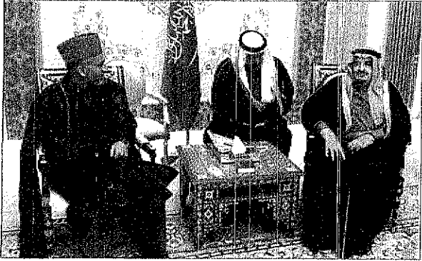
خادم الحرمين الشريفين يستقبل قرضاي