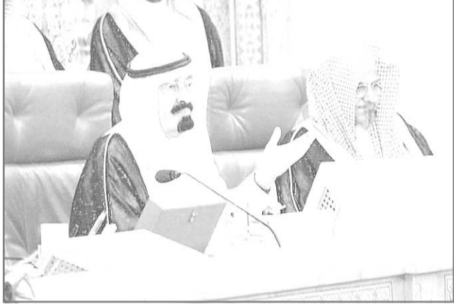
نائب الملك لدى افتتاحه دورة مجلس الشورى

المليك يهنئ رئيس كرواتيا واس (جدة) بعث خادم الحرمين الشريفين الملك فهد بن عبدالعزيز آل سعود برقية تهنئة إلى الرئيس ستيفان ميسيتش رئيس جمهورية كرواتيا بمناسبة ذكري اليوم الوطني لبلاده. وقد أعرب خادم الحرمين الشريفين باسمه وباسم شعبه وحكومة المملكة العربية السعودية عن أبلغ التهاني مفروونة باطيب تمنيات الصحة والسعادة لخادمته واضطراد التقدم والرقي لشعب كرواتيا الصديق. وأشاد الملك المفدى بمتانة العلاقات الطيبة بين المملكة وكرواتيا وشعبيهما.