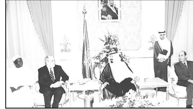
نائب الملك لدى استقباله السفراء المعتمدين