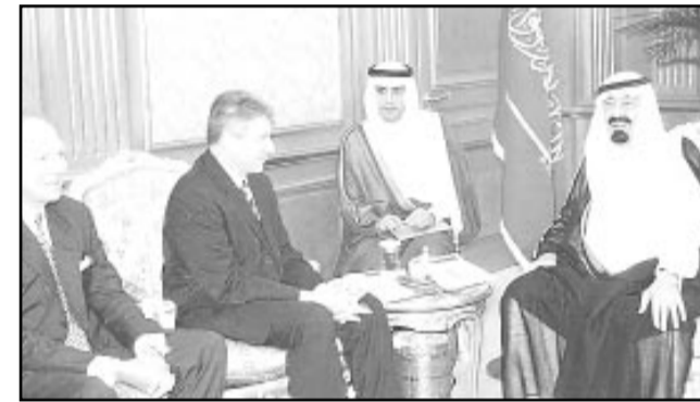
سموه لدى استقباله عضو الكونجرس الأمريكي

تسلم صاحب السمو الملكي الأمير عبدالله بن عبدالعزيز نائب خادم الحرمين الشريفين في الديوان الملكي بقصر السلام أمس أوراق اعتماد عدد من سفراء العربية والإسلامية والصدقية العربية والاسلامية والصدقية العربية معتمدين لدولهم لدى المملكة العربية السعودية . فقد تسلم سموه أوراق اعتماد كل من سفير استراليا روبرت جيمس تايسون وسفير جمهورية السنغال مودجا وسفير جمهورية سيراليكا ابراهيم صاحب انصار وسفير سويسرا دومينيك ماتياس وسفير جمهورية مصر العربية محمد رفيق خليل وسفير الجمهورية اليمنية خالد اسماعيل الاكوع وسفير الولايات المتحدة الامريكية روبرت ديليو جوردان وسفير الجمهورية الجزائرية عبدالكريم غريب وسفير اليابان نوبياسو ابي وسفير البوسنة والهرسك محمد علي حاجيتش وسفير مملكة البحرين راشد بن سعد الدوسري وسفير جمهورية التشيك زدينك بولاشيك وسفير الجمهورية الاندونيسية محمد مفتوح بسونتي وسفير جمهورية غانا عبدالرزاق محيي الدين طاهر وسفير جمهورية اتيوبيا مهدي احمد علي وسفير جمهورية البونان جورج بابا ديبوليس وسفير جمهورية روسيا البيضاء فالديمرين سوليمسكي وسفير جمهورية اوزبكستان اولوغ بيك عبدالقيوم قش اسرالوف وسفير الجمهورية الاسلامية الموريتانية سيدي محمد ولد محمد فال وسفير جمهورية اوكرانيا ليونيد غوريانوف .