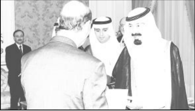
سموه يتسلم أوراق اعتماد السفير الجزائري