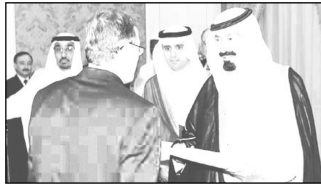
سموه يتسلم أوراق اعتماد السفير البوسني