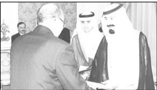
سموه يتسلم أوراق اعتماد السفير المصري