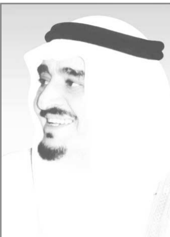
الأمير عبدالله بن عبدالعزيز آل سعود

□ اصدر خادم الحرمين الشريفين الملك فهد بن عبدالعزيز آل سعود امراً ملكياً بتعيين صاحب السمو الملكي الأمير عبدالله بن عبدالعزيز ولي العهد ونائب رئيس مجلس الوزراء ورئيس الحرس الوطني رئيساً للمجلس الأعلى لشؤون المعوقين