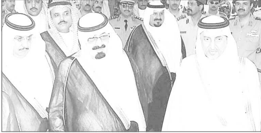
نائب المليك لدى وصوله ابها أمس

□ في اجواء مفعمة بالحب والحفاوة البالغة ووسط استقبال شعبي كبير وصل صاحب السمو الملكي الأمير عبدالله بن عبدالعزيز نائب خادم الحرمين الشريفين أمس الى ابها حيث يرعى سموه حفل افتتاح معرض القوات المسلحة الرابع كما يضع سموه حجر الأساس للمعرض الدائم للقوات المسلحة بقاعدة الملك خالد الجوية بالمنطقة الجنوبية، كما يرعى سموه بعض فعاليات مهرجان صيف ابها