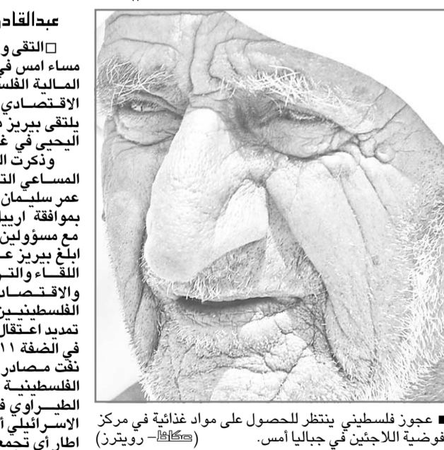
عجوز فلسطيني ينظر للحصول على مواد غذائية في مركز مفرضية اللاجئ في جبالياً، أس.

□ التقى وزير الخارجية الإسرائيلي شيمون بيريز مساء امس في القدس المحتلة مع سلام فياض وزير المالية الفلسطيني. وتم خلال اللقاء بحث الوضع الاقتصادي الفلسطيني واصلاحه. ومن المقرر ان يلتقى بيريز مع وزير الداخلية الفلسطيني عبدالرزاق البلجيني في غضون الاربعة والعشرين ساعة القادمة. وذكرت المصادر القريبة من الرئيس عرفات ان المساعي التي قام بها رئيس المخابرات المصرية عمر سليمان في التي قادت الى ترتيب هذا الاجتماع بموافقة اربيل شارون الذي كان يرفض عقد أي لقاء مع مسؤولين فلسطينيين وذكرت المصادر ان شارون ابلغ بيريز عدم طرح أي مسائل سياسية خلال هذا اللقاء والتكرير فقط على المسائل الأمنية والاقتصادية وبحث التسهيلات للمواطنين الفلسطينيين من جهة اخرى قررت اسرائيل أمس تعديد اعتقال مروان البرغوثي أمين سر حركة فتح في الضفة ١١ يوماً من نون محاكمة. وعلى صعيد آخر نفت مصادر فلسطينية نيا اقالة مدير المخابرات الفلسطينية في الضفة الغربية العميد توفيق الطيراوي في غضون ذلك أقر مجلس الوزراء الاسرائيلي امس قانوناً يمنع اقامة عرب «٤٨» في اطار أي تجمعات سكنية يهودية. (تفاصيل ص ٢٦)