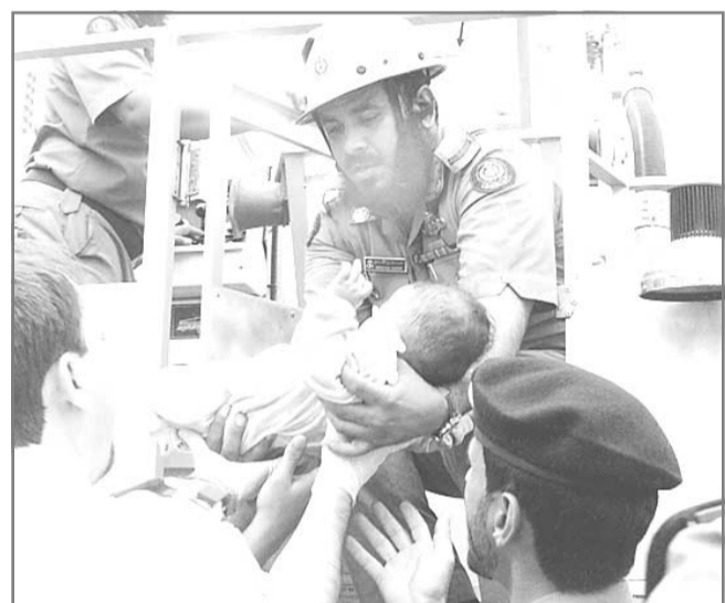
رجال الدفاع المدني يحملون الطفل الذي تم انقاذه أمس في حريق جدة