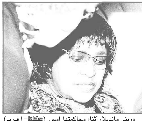
«ويني مانديلا» أثناء محاكمتها أمس.

الوكالات (بريتوريا) □ تلجأت محكمة ويني مانديلا مطلقة رئيس جنوب افريقيا السابق نيلسون مانديلا بتهمة الكسب غير المشروع من الأمم في اليوم بناء على طلب الدفاع. وكانت مانديلا قد منلت أمام القضاء أمس بتهمة سرقة اموال تزيد على مليون راند (١٠٠ الف دولار). وبدأت محاكمة ويني التي كان يطلق عليها (ام البلاد) أمس حيث وصلت الى المحكمة برفقة اربعة من الحراس وقد ابدت استياءها من المصورين والصحفيين وكان برفقتهما ايضا ابنتها زيندي زوي وورد في صحيفة الاتهام الموجهة اليها والي مولمان وسيطها المالي ٦٠٠ واقعة كسب غير مشروع و ٢٥٠ واقعة سرقة. وفجرت هذه المحاكمة جدلا جديدا حول ويني التي لا تزال تتمتع بشعبية بين فقراء جنوب افريقيا الذين يعضون الطرف عن اخطائها مقابل الدفاع عن حقوقهم. (تفاصيل ص ١٦)