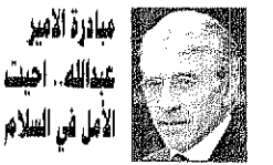
ترجمة: محمد بشير جابري