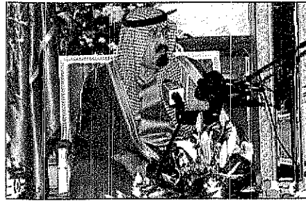
سمو وافي العهد لدى حديثه مع ضيوف الجنادرية

• نصيحتي لبوش ان يراعي مصلحة امريكا.. والارهاب منبوذ اصلا • القمة العربية في موعدها المسحود وسيكون الاخ ياسر عرفات بيننا • الدفاع عن الدين والارض والشرف والعرض ليس اربابا