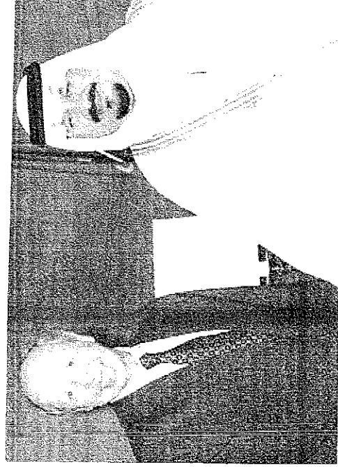
وزير الخارجية الإيطالي مع الأمير سلطان خلال زيارة سموه لروما

ويعتبر سموه من سادة شخصيات المنطقة العربية، لما يملكه من مكانة رفيعة في دولته، إضافة إلى دوره البارز في تعزيز العلاقات الدولية.