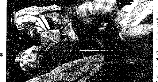
سعود ولي العهد ورئيس مافيتسان بيبسيمان أثناء مشاركتهما في اجتماعات لوزراء دفاع جنوب أفريقيا مع سمو ولي العهد في جوهانسبرج.

سعى وفد سمو ولي العهد إلى تعزيز العلاقات مع الجانب الإفريقي، وذلك من خلال توقيع اتفاقيات تجارية وإقتصادية، تشمل مجالات التعليم والعلوم والتكنولوجيا.