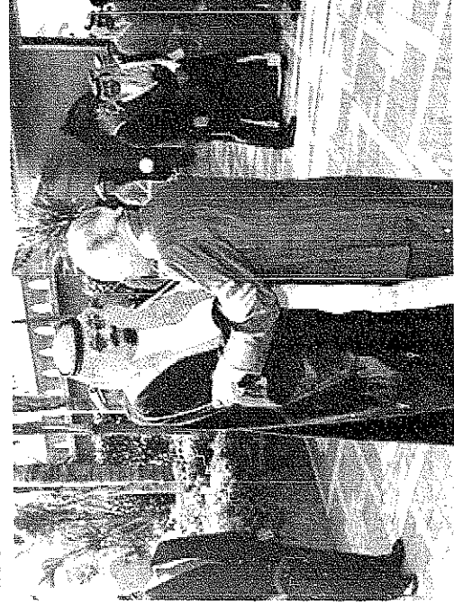
سعود ولي العهد لدى لقائه بالعمال العربى