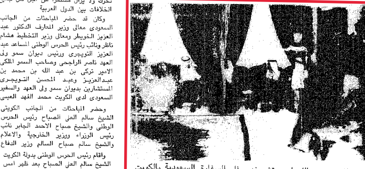
سمو الامير عبد الله لدى تشريفه حفل السفارة السعودية بالكويت