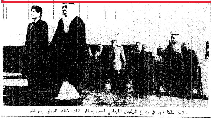
جلالة الملكة فهد في وداع الرئيس اللبناني امس بمطار الملك خالد الدولي بالرياض