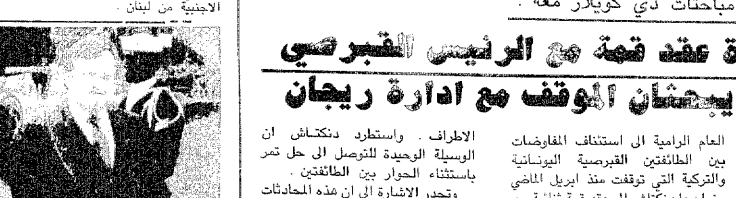
الوفد السعودي في زيارة الى واشنطن

اننا نؤمن من الطبيعي ان يكون هذا التحرك سواء من خلال مجلس التعاون لدول الخليج العربية ، او من خلال جامعة الدول العربية ..