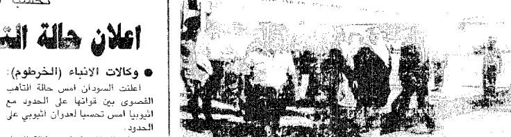
الوفد السعودي في زيارة الى واشنطن